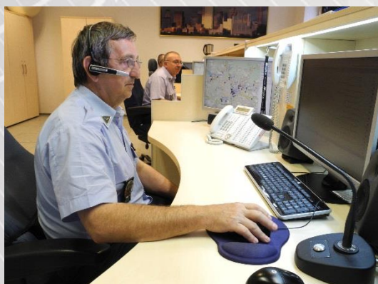
Ilustrační foto dohledového centra MP Brno.

Do komunikačního systému městské policie je integrována služba INFO 35 . Tuto službu poskytuje komunikační operátor a díky STAND zakázkové úpravě mají nyní policisté na dispečinku k dispozici údaje o volajícím ve formě automaticky se zobrazujícího informačního okna na monitoru jejich PC. Okamžitě zde vidí telefonní číslo, jméno a adresu volajícího. Mohou tak hovory rychle a efektivně obsluhovat, přepojovat do místních služeben či na konkrétního policistu vykonávajícího službu v potřebné lokalitě.